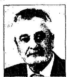
JOSÉ ANTONIO GRINÁN "Los datos tienen su cara positiva"

El consejero de Economía y Hacienda, José Antonio Grinán, explicó ayer que los datos de la EPA contienen "dos caras": se produce una pérdida de 26.000 empleos agrícolas, tendencia reiterada desde hace años, pero se compensa con una subida en la industria y los servicios.