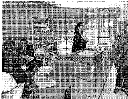
El stand de Cajasol, momentos después de la apertura del Foro

Asimismo subrayó que «cuando alguien se siente marginado, ya sea por motivos sociales, económicos o de cualquier orden, el primer y más importante paso que debe dar es el de encontrar un trabajo».