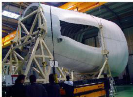
Pieza del A350

La construcción de las instalaciones saldrá inmediatamente a licitación, según aseguraron fuentes cercanas al consorcio, y la adjudicación se producirá a finales de mayo. La obra se iniciará, por lo tanto, en el mes de junio y el plazo de ejecución será de ocho meses, por lo que el horizonte de finalización es enero de 2010. El objetivo es que el nuevo centro aeronáutico arranque, en periodo de pruebas, en el primer trimestre del próximo año, para que la actividad productiva pueda empezar tras el verano.