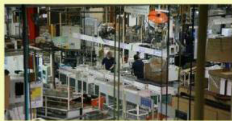
Maquinaria de Delphi