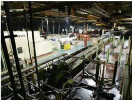
Maquinaria de Delphi

Uno de los responsables de esta firma y coordinador de la operación explicó que el dinero resultante de toda la enajenación estará a disposición de la administración concursal en el plazo aproximado de un mes, a partir de la finalización del proceso. Una vez realizado el pago, el futuro de la factoría quedará en manos, únicamente, de los administradores concursales y del Juzgado de lo Mercantil.