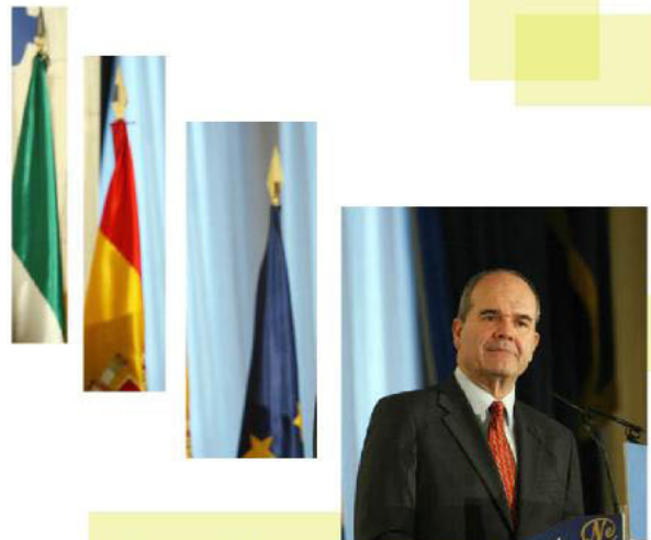
Manuel Chaves, Presidente de la Junta de Andalucía

Chaves habló de las posibilidades de desarrollo venidero: la recolocación de ex trabajadores de Delphi en las empresas que tendrán que paliar el cierre de la multinacional y el proyecto empresarial de Las Aletas. En ambos casos prometió que el final será feliz, pese a los problemas económicos de algunas de las empresas que dijeron que se instalarían y a los obstáculos judiciales con los propietarios de gran parte del suelo donde irá el nuevo motor económico de la Bahía de Cádiz.