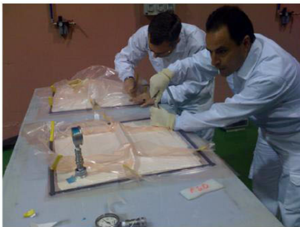
Ex trabajadores de Delphi, durante unas prácticas