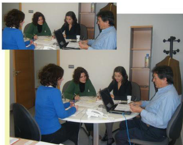
Reunión del Director del Programa con el equipo de prospección

En el Área de Prospección se viene desarrollando un Plan de Trabajo con objetivos a conseguir y acciones concretas a desarrollar para alcanzarlos. Así, se realizan búsquedas de ofertas de trabajo en Internet y en la prensa, además de revisar a diario las noticias económicas para detectar posibles oportunidades laborales. También se lleva a cabo una búsqueda personalizada de “empresas diana”, adecuadas a los perfiles de los candidatos, y un programa de visitas sistemático a polígonos y concentraciones de empresas industriales y de servicios, buscando ofertas de trabajo para ofrecérselas a nuestros candidatos. Asimismo, se están visitando los ayuntamientos de la zona para tratar de captar nuevos puestos de trabajo en la Administración Local. Todas las ofertas de empleo conseguidas se ponen a disposición de los candidatos, y, si se adecuan a su perfil, se envía su currículum vitae a las empresas interesadas y se ayuda a los candidatos a preparar la entrevista de selección. Posteriormente, se hace el seguimiento de estos procesos de selección para conocer su desenlace que, en el caso de ser positivo, conlleva el apoyo al trabajador recolocado durante sus primeros pasos en la nueva empresa.