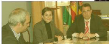
Reunión mantenida con el Alcalde de El Puerto de Santa María, Enrique Moresco García