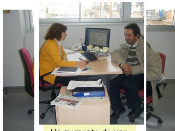
Un momento de una tutoría presencial

La Comisión de Seguimiento, en su reunión del 24 de septiembre de 2007, decidió que el DTS para el colectivo procedente de Delphi se ubicara en Jerez de la Frontera. Se acordó también que dicho Dispositivo realizara acciones de información, orientación, asesoramiento y diseño del Itinerario Personalizado de Inserción (IPI). Para ello, dispuso que a cada uno de los afectados se le realizara una entrevista en profundidad, que determinara los perfiles profesionales y la capacidad e idoneidad de los mismos, con carácter previo a su inclusión en el Plan Formativo. Cada afectado, como compromiso con el IPI y el Plan Formativo, debía suscribir su adscripción al Programa de Reinserción Laboral.