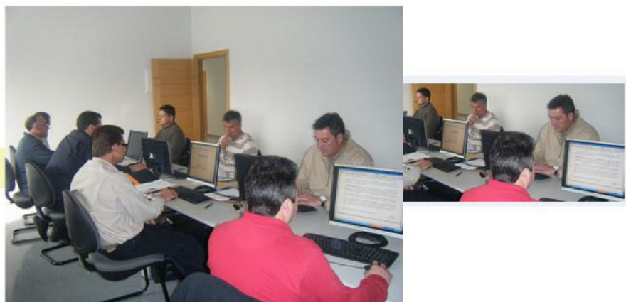
Sala de informática

En el Área de Consultoría, entre otras tareas, se llevan a cabo acciones de atención individualizada a los candidatos: asesoramiento, orientación laboral, personal y de apoyo psicológico; mediante tutorías presenciales y telefónicas. Se realizan también actualizaciones de currículos y se adecuan los mismos para posibles ofertas de empleo. También se hace el seguimiento del Programa “Brújula”, abierto a su ejecución para todos los candidatos, que se entrenan y simulan entrevistas de trabajo, para garantizar un buen resultado en los procesos de selección de personal.