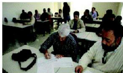
Ex trabajadores de Delphi, formándose en un curso

Estos cursos tendrán una duración de 650 horas, de las que 52 serán tutorías presenciales. Se impartirán en los centros habituales de Cádiz, San Fernando, Chiclana, El Puerto, Rota, Sanlúcar y Jerez, además de en Alcalá de los Gazules o Benalup.