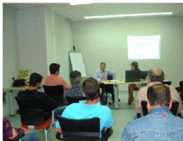
Uno de los talleres de autoempleo que se llevan a cabo para los ex trabajadores de Delphi

A los alumnos se les explicó el concepto de empresario, y las características que debe reunir el mismo, como la autoconfianza, ideas claras, capacidad para organizar y para asumir riesgos, iniciativa, creatividad, sentido de la oportunidad, e innovación.