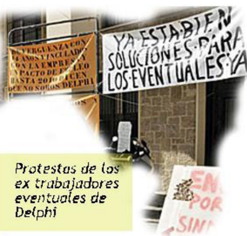
Protestas de los ex trabajadores eventuales de Delphi