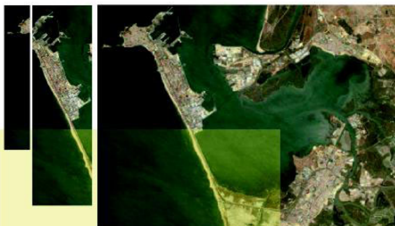
Imagen aérea de la Bahía de Cádiz

En concreto, junto al Software Factory de Sadiel, que está en funcionamiento, han iniciado su inversión Gadir Solar y TerraSun, y en las próximas semanas, lo harán Gadir Cogeneración, Celulosa Investment, Génesis Solar y Alestis Aerospace. Asimismo, Aeroblade, con su proyecto de la fábrica de palas eólicas, comenzará a desarrollar su inversión entre el final de 2009 y comienzos de 2010.