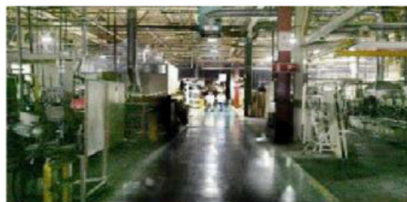
Instalaciones de Delphi, antes del cierre

Para conseguir este contrato, el consorcio andaluz ha competido con Vvought (EEUU), Spirit (EEUU), Alenia Aeronáutica (Italia, antigua propiedad de Fiat) y MTAD (División de Aviones de Transporte Militar de EADS, que desde diciembre del pasado año se ha integrado en Airbus).