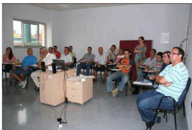
Ex trabajadores de Delphi asisten a una sesión presencial del Programa “Brújula”

Una vez finalizada la etapa profesional desarrollada en Delphi, comienza una nueva fase en la que, tras pasar tantos años en la misma compañía y sin salir al mercado laboral, no siendo ya tan joven, lo habitual es que al profesional le asalten muchas dudas: ¿Y ahora, cómo encuentro un nuevo empleo? ¿Cómo me doy a conocer? ¿Cómo y qué debo hacer para presentarme en una empresa? En definitiva: ¿Cómo convierto mi formación y sobre todo mi experiencia, después de tantos años, en un valor tangible para una empresa?