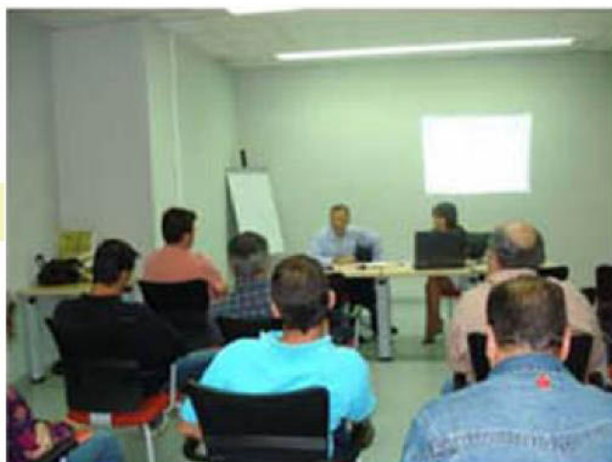
Taller de Autoempleo en el DTS

Puedes acceder o descargar el documento íntegro firmado el pasado 16 de enero en la siguiente dirección: https://www.create-online.com/delphi/docs/protocolo_ene.pdf