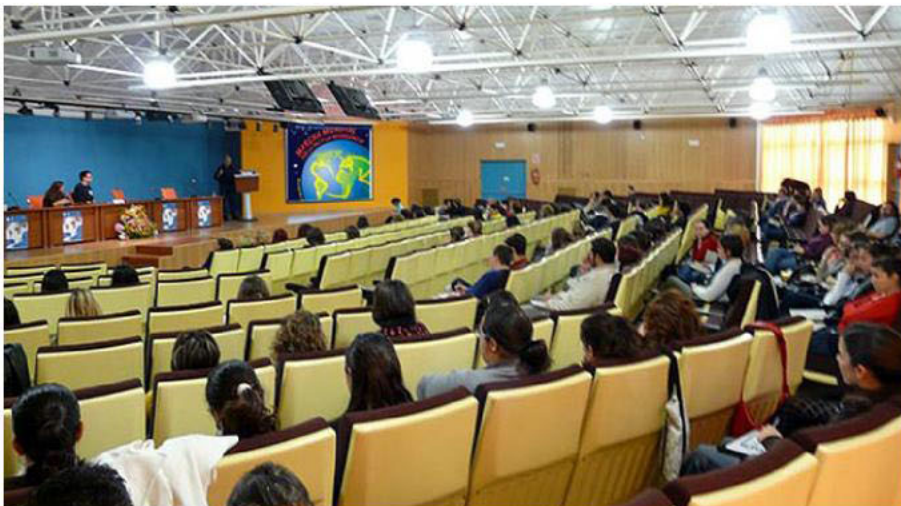
Aula Magna Universidad de Cádiz