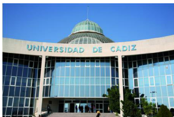
Universidad de Cádiz

Según consta en el IX Desarrollo del Protocolo de Colaboración, dicha formación será compatible, en el supuesto de que coincidiera, con la impartida por las empresas interesadas en contratar a ex trabajadores de Delphi. También se detalla que el periodo de formación se iniciará el próximo 9 de febrero y se extenderá hasta el 31 de julio de 2009.