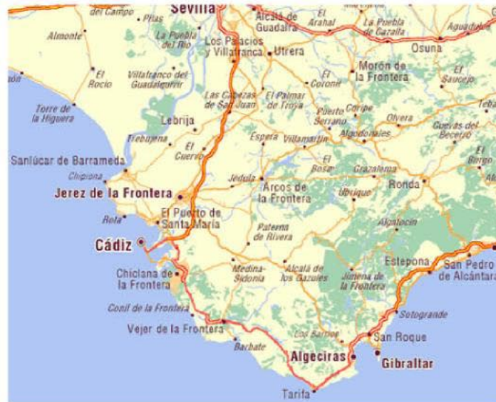
Provincia de Cádiz

En cuanto a la región, el paro registrado bajó en mayo en 7.346 personas, con lo que el número de desempleados en Andalucía se situó en 789.121. En España, se registró un descenso de 24.741 parados, estableciéndose en 3.620.139 el número de personas desempleadas.