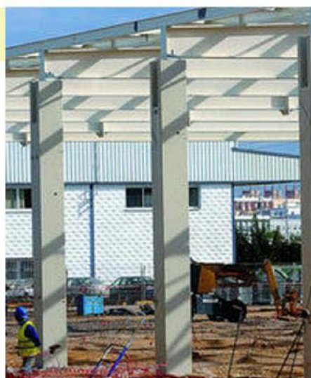
Construcción de la nueva factoría de Gadir Solar

Por lo que respecta a los perfiles profesionales requeridos por Gadir Solar, la mayoría de los ex trabajadores de Delphi (176) fueron preseleccionados para las vacantes de los trabajos especializados en el manejo del cristal; el siguiente grupo con mayor número de ex trabajadores de Delphi enviados es el especializado en trabajos manuales, para los que fueron presentadas 91 personas; el tercer grupo de perfil profesional requerido por Gadir Solar es el de “operadores”, para el que fueron enviados 82 currículos; también fueron preseleccionados 28 profesionales expertos en materias relacionadas con la Calidad, y 14 técnicos.