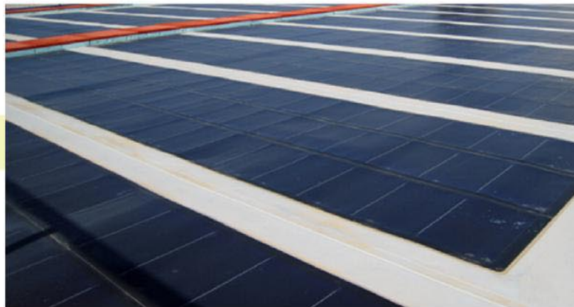
Silicio amorfo de película delgada

La firma -que facturará placas fotovoltaicas, con una tecnología llamada de ‘silicio amorfo de película delgada’- ya cuenta con 42 personas en plantilla. La planta producirá anualmente el equivalente a 40 megavatios en placas fotovoltaicas.