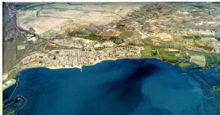
Imagen aérea de Puerto Real

Este nuevo paso de la Junta supone el blindaje de este proyecto, a través de la declaración de interés autonómico de todas las iniciativas que se lleven a cabo en este espacio de 527 hectáreas, que se encuentra en el término municipal de Puerto Real.