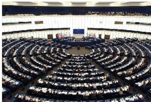
Sesión del Parlamento Europeo en Estrasburgo

Los eurodiputados reunidos en Estrasburgo, en sesión plenaria, aprobaron la subvención por 634 votos a favor, 32 en contra y 19 abstenciones.