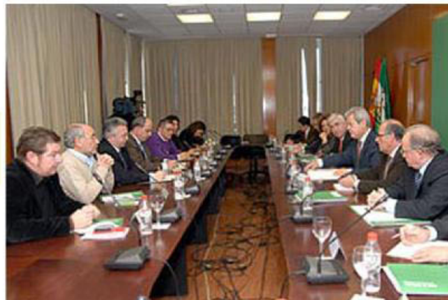
Comisión de Seguimiento del Plan Bahía

Puedes descargarte el Plan Bahía Competitiva completo en la sección de "Documentos" de la página web: