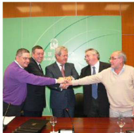
Comisión de Seguimiento

La Junta de Andalucía y los sindicatos que representan al colectivo de ex trabajadores de Delphi acordaron en su día un Protocolo de Adhesión al Programa de Reinserción Laboral. Este Protocolo fija el derecho de los adheridos al Programa a recibir una oferta de trabajo con determinadas garantías, así como sus obligaciones a la hora de participar en las actividades formativas y de intermediación laboral que se están desarrollando.