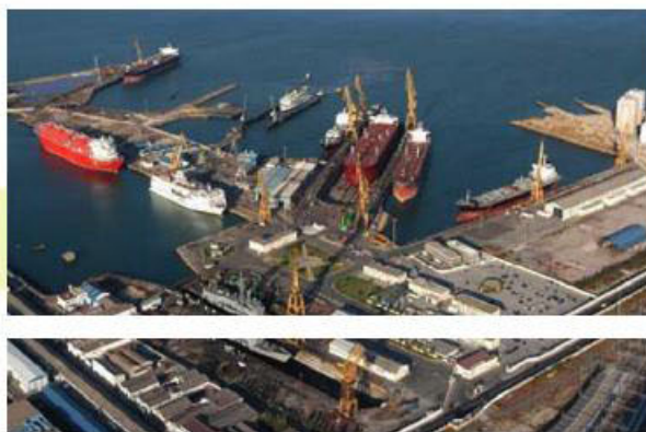
Factoría de Navantia en Cádiz