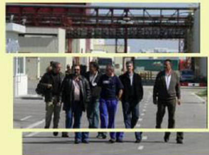
Representantes de CCOO

La Comisión trató también el tema de la reposición de las prestaciones por desempleo y corrigió algunos problemas que afectaban a unas 20 personas, en su mayoría de la industria auxiliar.