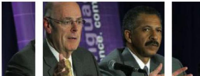
Los presidentes ejecutivos de Delphi, Robert Miller y Rodney O'Neal

El grupo estadounidense Delphi entregó en marzo de 2007 su informe anual a la Comisión del Mercado de Valores de Estados Unidos. En él, Delphi señalaba que analizaba todas las opciones estratégicas para contener el coste del cierre de su planta de Puerto Real (Cádiz).