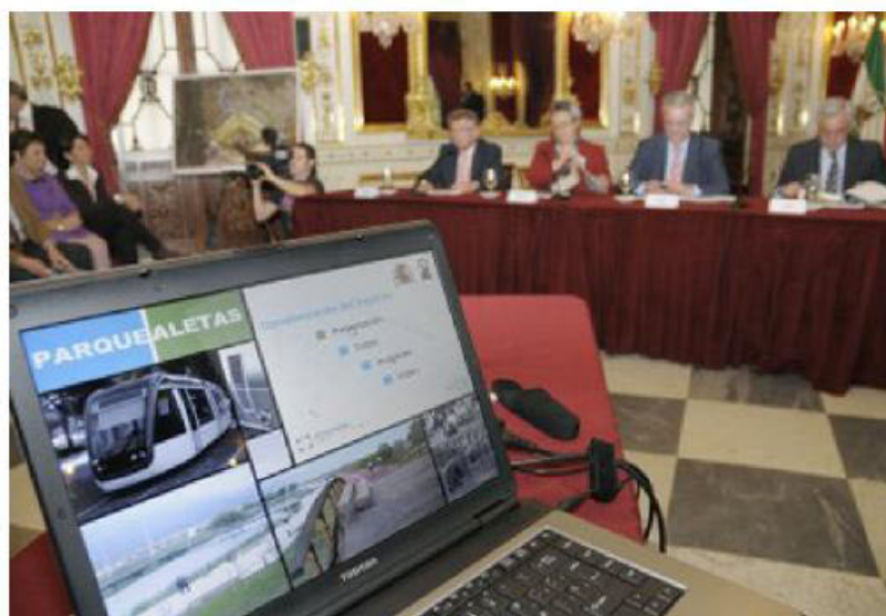
Proyecto Las Aletas