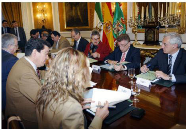
Reunión del Consejo Rector de Las Aletas

Para Barroso, el nuevo documento urbanístico de Puerto Real contempla iniciativas fundamentales para el término municipal: “Es la consolidación del modelo de ciudad por el que hemos venido apostando desde hace decenios”, y añadió que “la apuesta por lo que van a ser las señas de identidad de nuestra economía en el futuro es evidente, como la industria, el desarrollo universitario, el Polígono de Las Aletas, las energías limpias, la actividad portuaria, la consolidación de los grandes sistemas dotacionales y públicos o el crecimiento ordenado con desarrollo sostenible”.