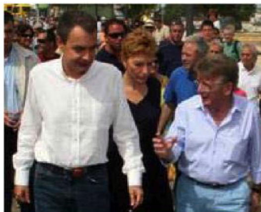
El Presidente del Gobierno, José Luis Rodríguez Zapatero

El Presidente del Gobierno, José Luis Rodríguez Zapatero, visitó Sanlúcar de Barrameda en agosto de 2007, tras el cierre de Delphi. En el encuentro, Zapatero aseguraba que, “gracias a la colaboración total con la Junta de Andalucía, se propiciará la instalación de empresas en la zona que reportarán un futuro de esperanza a la Bahía de Cádiz”.