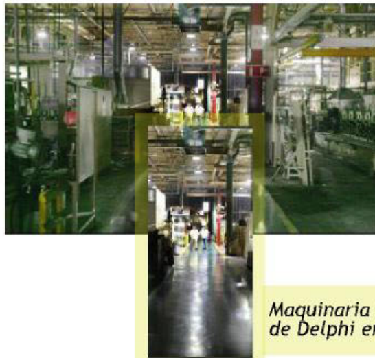
Maquinaria de la planta de Delphi en Puerto Real

Esta oferta, presentada ante el juzgado el pasado 22 de mayo por la empresa catalana Ferbossa Industriactiva, en asociación con Hilco Industrial Europe LTD, competiría con otra presentada por la matriz de componentes de automoción Delphil, que ofrecería 4,2 millones de euros por una parte de los equipos industriales.