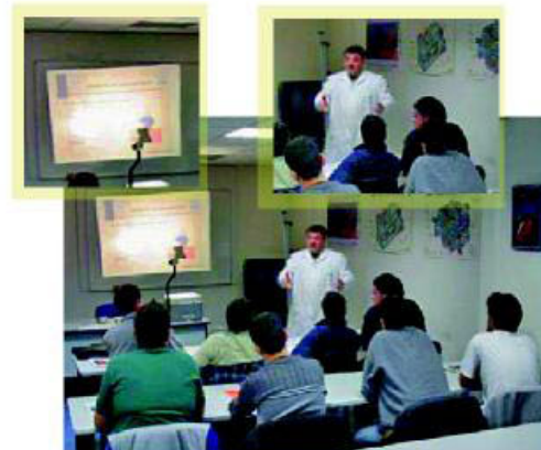
Aula de formación