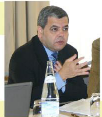
El Viceconsejero de Empleo, Agustín Barberá

Barberá precisó que en estos cursos prácticos se “impartirá formación relacionada con la demanda de las empresas que se van a implantar, pertenecientes a los sectores aeronáutico, industrial-naval y de energías renovables”. El Viceconsejero resaltó el hecho de que estos cursos “permitirán un igual grado de empleabilidad para todos los ex empleados de Delphi”. “No es el momento de crear grupos de trabajo en sectores muy concretos, ya que ello limitaría las posibilidades de inserción”, afirmó.